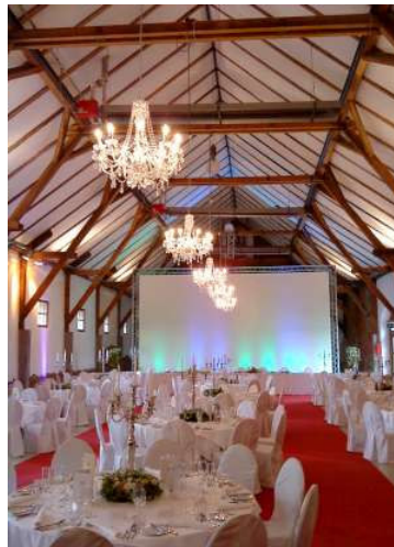
Unten links: Fachwerkhalle mit runden Tischen und Stühlen mit Hussen