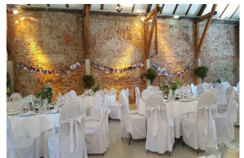
Unten rechts: Fachwerkhalle mit runden Tischen und Hussensessel