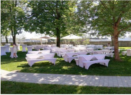
Links oben: Gartenbereich mit Biertischgarnituren

Bildbeispiele: (Weitere Fotos unserer Website unter www.seifenfabrik.info )