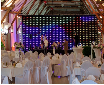
Oben Mitte: Fachwerkhalle mit schwarzen Abhang davor LED Vorhang