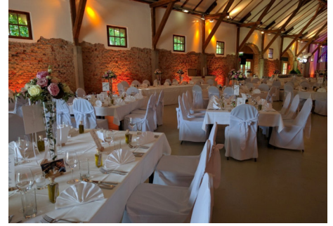
Oben rechts: Fachwerkhalle mit hauseigenen eckigen Tischen und Hussensessel