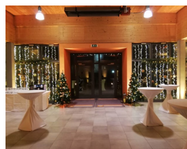
Foyer mit Stehtischen