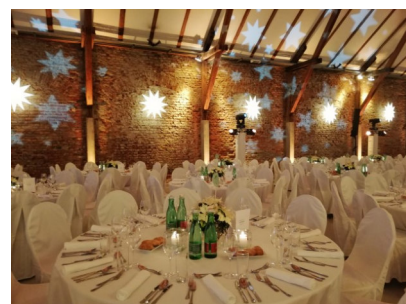
Fachwerkhalle mit runden Tischen, Sesseln mit Hussen + leuchtenden Sternen mit bewegtem Ambientelicht