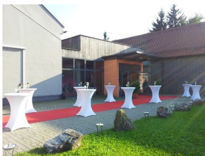
Foyer Vorplatz mit rotem Teppich, hauseigenen runden Stehtischen und Hussen + Feuerschalen