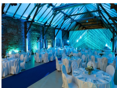
Fachwerkhalle mit runden Bankettischen, Hussensessel und Ambientelicht bewegt