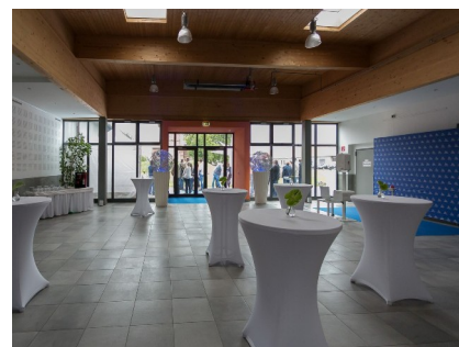
Foyer Innen mit ovalen Hochtischen mit Hussen + Dekolichtkugeln