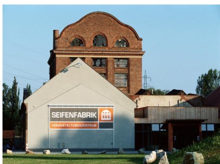
Außenansicht Seifenfabrik Veranstaltungszentrum